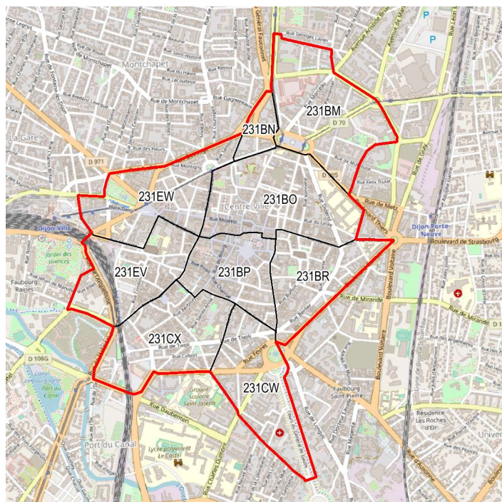
Centre-ville de Dijon